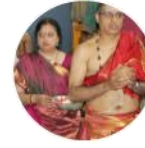
ಸ್ವಭಾವಾನನ್ದ ನಾಥ/ ಕಾಮೇಶ್ವರ್ಯಮ್