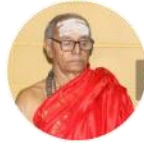
ಪೂರ್ಣಾನನ್ದ ನಾಥ/ ಪೂರ್ಣಾಮ್