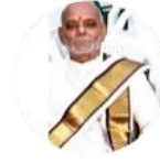
ಪೂರ್ಣಾನನ್ದ ನಾಥ/ ಲೋಪಾಮುದ್ರಾ