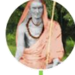
ಪ್ರಕಾಶಾನನ್ದ ನಾಥ/ ವಿಮರ್ಶಾಮ್