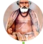
ಕಾಮೇಶ್ವರಾನನ್ದ ನಾಥ/ ಕಾಮೇಶ್ವರ್ಯಮ್