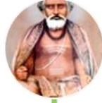
కామేశ్వరానంద నాథ / కామేశ్వర్యమ్బా